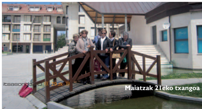
itsasondoko (( 29.zk ))

LASTER SOMATUKO DUZU ONURA ZURE GORPUTZEAN! ■