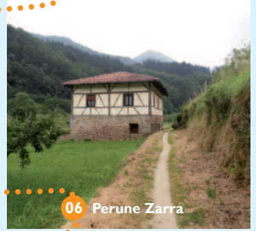
06 Perune Zarra