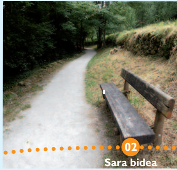
02 Sara bidea