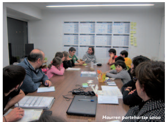
Haurren partehartze saioa

Orain arte, festen inguruan eta udalekuen inguruan haurrei iritzia emateko saioak prestatu dira eta beraien ekarpenak jasota, horiek martxan jartzeko bidea egiten ari gara. Hain zuzen ere, haurrek beraiek aukeratuko dituzte puzgarriak eta udalekuetako programa ere beraiek osatu dute eta hori aurrera eramaten saiatuko gara. ■