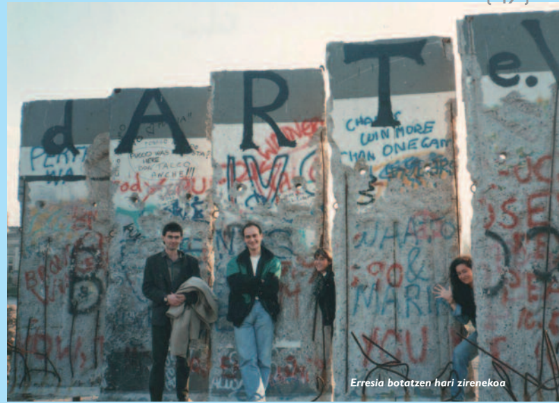
Erresia botatzen hari zireneko

Ordun, ez da etortzen goitio ezerre? Goitio oso gutxi, oso gutxi, zen inbertittu behar dan guztie pasatu beaittu barrera asko ta gustoa ez badau baten bat, esanez Legorretako bat gustoa ez badau hemen diputaziok dirue inbertittu zan in ditzazke firma batzuk bildu ta botazio bat iñazi Gipukoa gutzin, in ez dadin. Osea, dirue jutea betik gora ta ez goitik bera, ta horrek gauza asko aldatzeittu. Responsabilidadea hik dauke hire dirukiñ ta ez da eskatzea goitik bera. Horregatik gauza askok diferente funtzionatzen due. Ta ez da hoi bakarrik, osea jendek dauke berez responsabilidadea gehio, gero referendum esaten zaion horrekin. Gobierno zentralak Suizan botere bazeuek, baiño jendei gustatzen etzaion zerbait in nahi baldin badu seittun oso zaia dute. Ta