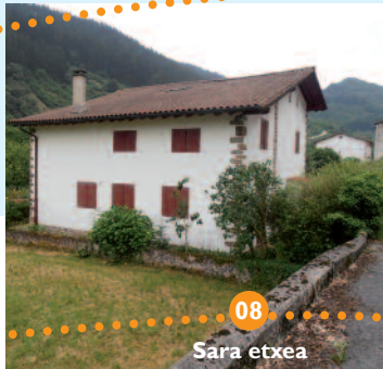
08 Sara etxea