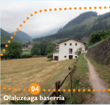
04 Olaluzeaga baserria