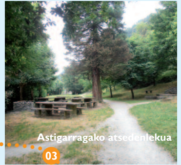
03 Astigarragako atsedenekua