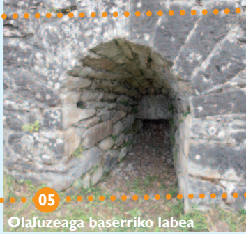
05 Olaluzeaga baserriko labea