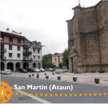
01 San Martin (Ataun)