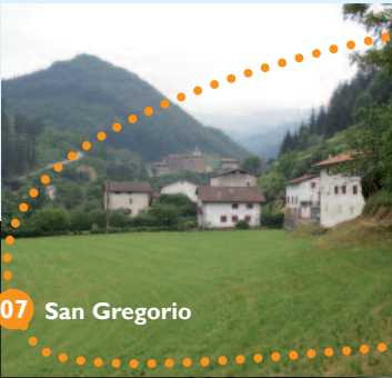
07 San Gregorio