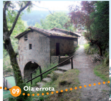
09 Ola errota