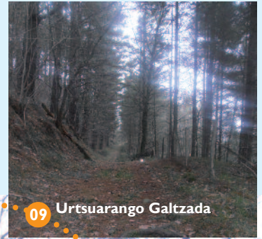
09 Urtsuarango Galtzada