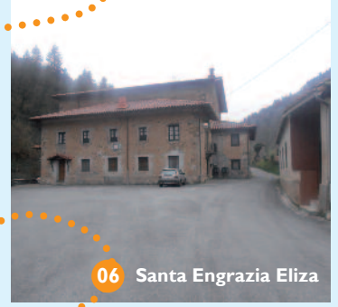
06 Santa Engrazia Eliza