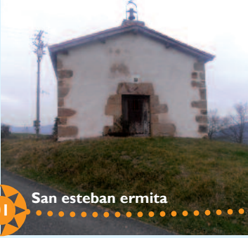
01 San esteban ermita