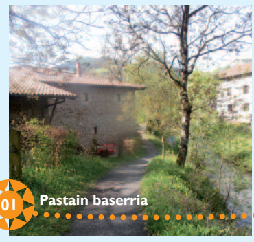
01 Pastain baserria