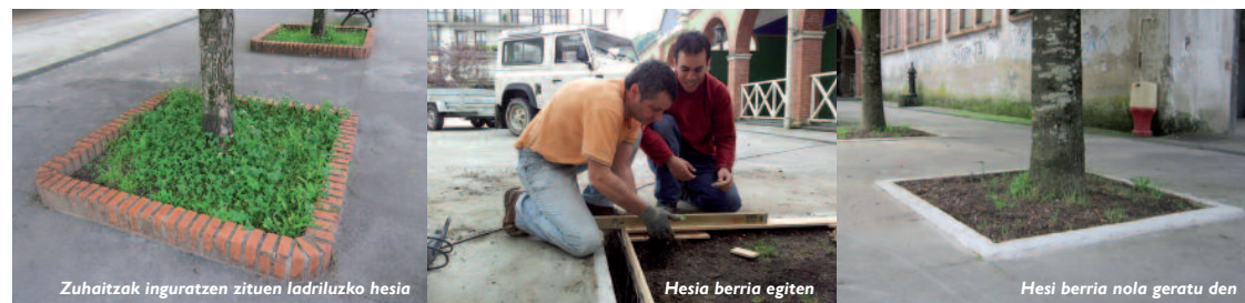
Zuhaitzak inguratzen zituen ladriluzko hesia