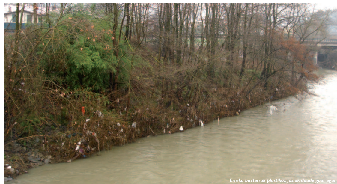
Erreka bazterrek plastikoz josiak daude gaur egun.

Bestetik, aipatzekoa da, azken asteetan Cortaderia selloana, pampako plumeroa bezala ezaguna den espeziaren aurka egin diren lanak. Espezie hori apaingarri gisa dago eremu pribatu askotan, eta medioa eraldatzeko duen gaitasuna ikusirik, apaingarri gisa erabili daitezkeen beste espezie edo fruitu arbolak jarrita ordezkatzeko proposatu zaie lur jabeei. ■