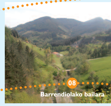
08 Barrendiolako bailara