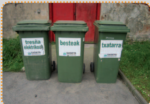
Edozein elektragailu txiki, jostailu edo txatarra botatzeko baldin badezute, goizetan Udaletxe aurrean dauden ontziak erabili dezakezue.