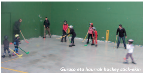
Guraso eta haurrak hockey stick-ekin

Asmo hori genuen, behintzat, aurreko larunbatean 11:00etan frontoian azaldu ginonok!