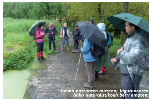
Loaia putzuaren aurrean; ingurunearen balio naturalistikoaren berri ematen.

Eguraldiari aurre eginez, 15 bat lagun abiatu ginen loaia auzotik Murumendiko tontorrerantz. Behelainoa lagun, bide honetan topatzen genituen balio naturalistikoaren inguruko azalpen eta bitxikeriak entzuteko aukera izan genuen Aranzadiko botanikarien eskutik: loaia putzua, landa auzoen garrantzia, azken urteetako paisaiaren bilakaera, zuhaitz mugarratuen berezitasunak, landare espezie bereziak... Eta azkenik, tontorretik gertu baso naturalen berreskurapenerako Udalak aurrera eraman dituen ekintzak gertutik ikusi eta ezagutzeko aukera izan genuen.