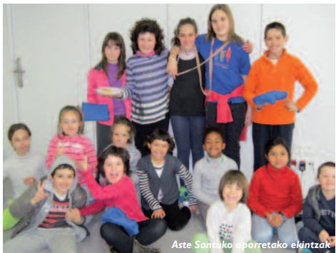
Aste Santuko oporretako ekintzak