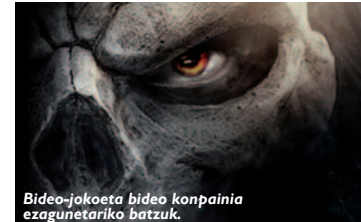
Bideo-jokoeta bideo konpainia ezagunetarikoa batzuk.