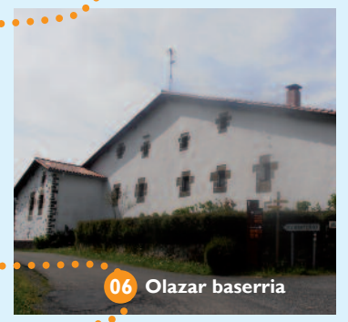
06 Olazar baserria