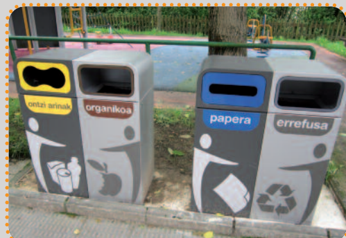
Orain, hondakinak ondo sailkatzeko aukera daukagu, herrian zehar jarri diren "zakarrontzi" berrietan.