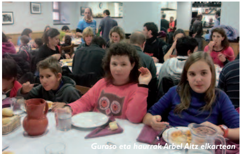
Guraso eta haurrak Arbel Aitz elkarte