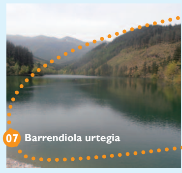
07 Barrendiola urtegia