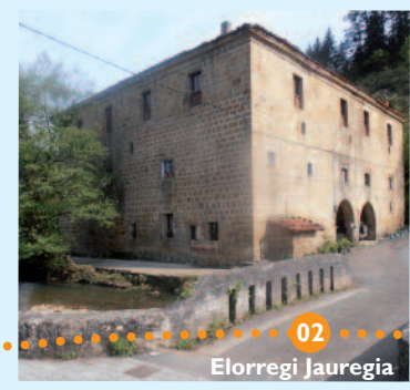
02 Elorregi Jauregia