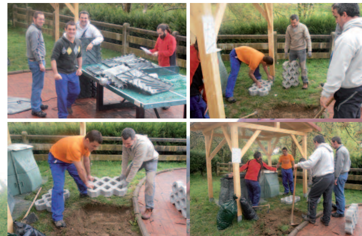
Auzo-konpostagailuaren montaita prozesua nola egin zen pausoz-pauso ikus daiteke.

Uztailak 3, 19:00etan Ludotekan, konposta nola egiten den ikastaroa izen ematea: Itsasondoko Udaletxean, 943 881170 Sasieta mankomunitatean 943 161555 Anima zaitez!